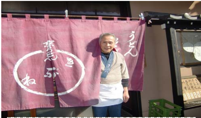
「京うどん・きぶね」店主 平戸2丁目31-3、平和台の広い道路、半田医院 (ミニバス・町内会館前) 近くにあります。月休み