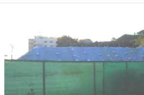
青いシートがかけられている残土の奥がトンネル

②置かれている残土は、同じ戸塚区内の環状3号線の工事から出された掘削土です。土砂は良質土であるため、来年度の別の工事に埋戻材として流用される予定で仮置きしています。