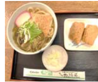
きぶねうどん セットいなり付

そばとうどんが表裏になっている「そどん」を発明し、テレビや雑誌、タウンニュースで度々紹介されました。1月27日、TBSテレビの「噂のマガジン」でも放映されました。