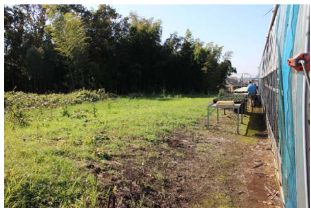
開発計画が予想される土地 深谷町 623 番地付近 右側が花卉栽培用ハウス