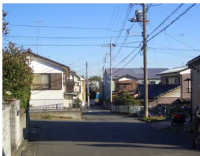
新築住宅群を背にして撮影