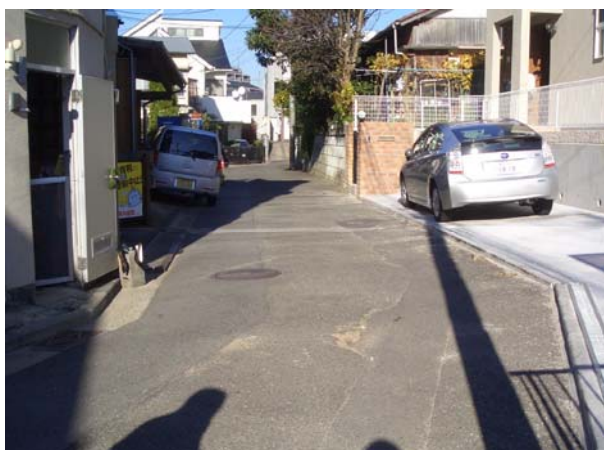
上倉田町 1840 番地付近 右側新築完了の住宅