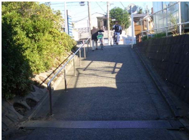
上倉田町 350 番地付近 隧道東側

高齢者、幼児を連れたお母さんが、躓（つまず）いて危ない。安心して通れるように路面の舗装や亀裂・段差の解消など改修を要望します。