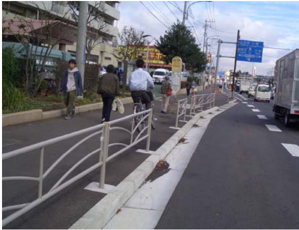
聖母の園前バス停付近（10月21日撮影）