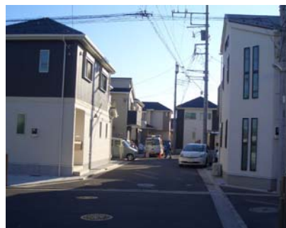
既存住宅地から変形交差部分を撮影