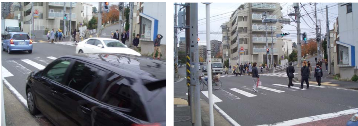
東戸塚小学校通学路 戸塚税務署入口交差点 11月25日登校時間の状況

児童の登下校時は、車と児童が錯綜して大変危険な状態です。「歩車分離方式」にするなど、至急安全対策を講じることを要望します。