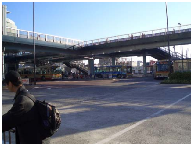
一号線側から撮影