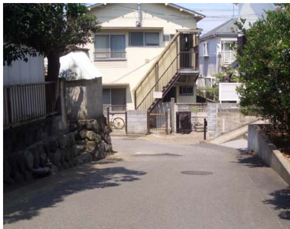
左側写真の前方ヶ所