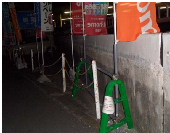
撤去を警告する張り札