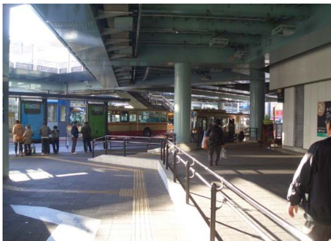
トツカーナ側からバスセンター撮影

372・ 戸塚駅西口バスセンター・交通広場に、バス待ちの人がどこからでも見える大きな時計の設置を要望します。