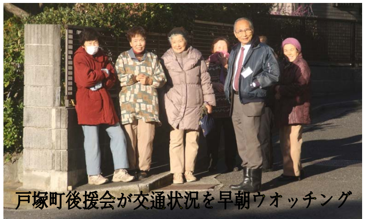
戸塚町後援会が交通状況を早朝ウォッチング

12月16日、戸塚町後援会のみなさんが、岩崎議員とともに、朝の交通状況をウォッチングしました。