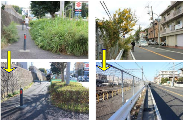
(写真左) 影取町 24 番地付近の国道一号線植栽整備 (右) 上倉田町 295~343 番地付近の JR 線沿い道路の雑草除去