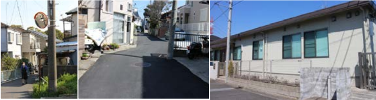
(写真左から)カープミラー設置(戸塚町) 道路舗装(上倉田町) 遊休施設が学童保育所に(柏尾町)