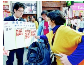
アンケートに응じる人 たち。「賛成」はゼロ。 14日、東京都板橋区

消費税増税シールアンケートから ●給料なんて上がっていない。上がったのは消費税だけだ。いい加減にしてしろよ。 ●70歳になっても医療費窓口負担が1割にならないじやないか。消費税は社会保障