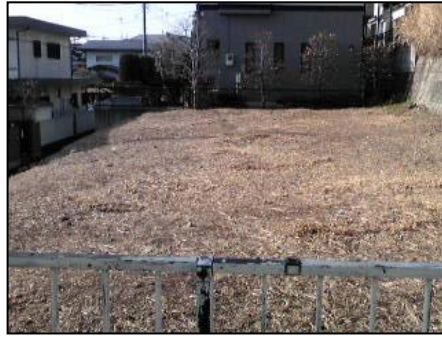
平戸町 管理放置の空き地の状況 (左:対策前 右:対策後)

平戸町401付近にある空き地は、雑草がのび放題で近隣に迷惑をかけていました。野ネズミの大量発生、雑草が生い茂ることによる周辺環境の悪化、火災の恐れ等により、近隣住民は大変困っていました。区役所に要望した所、早速消防署に話がいき消防署の指導で、キレイになりました。