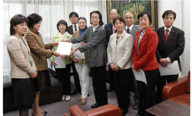
池戸女性活躍・男女共同参画担当理事(左から2人目)に申入書を手渡す日本共産党横浜市議団=11月20日、横浜市役所

申し入れでは、男女間賃金格差の是正の取り組みを重点施策として明確に位置づけ、具体的な事業を定めること、保育所・学童保育・高齢者福祉の充実、中学校給食の実施、小児医療無