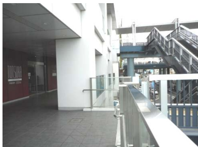
二階入口、二～三階外階段付近（11月15日撮影）