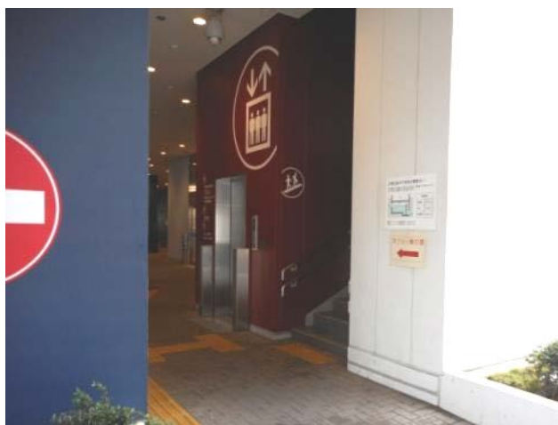
来庁者一階入り口付近（11月15日撮影）

窓口利用者が、二階窓口への移動をしやすくする為に、エスカレーターの設置やエレベーターの改善等を速やかに行うことを要望します。