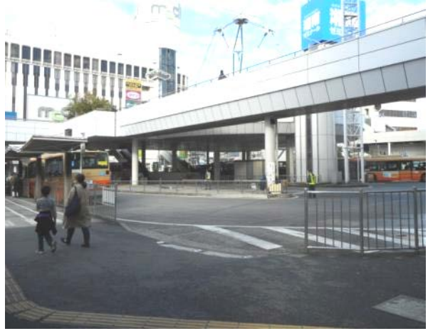
戸塚駅東口バス降車場所から地階、デッキへ 階段だけの現状（11月15日撮影）