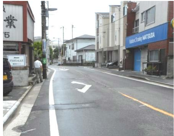
舞岡町58～100番地付近市道の舗装状況（7月17日撮影）