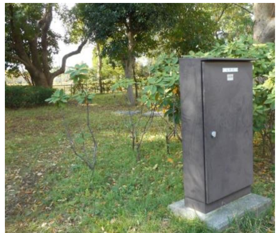
送水ポンプ施設・故障中（11月13日撮影）