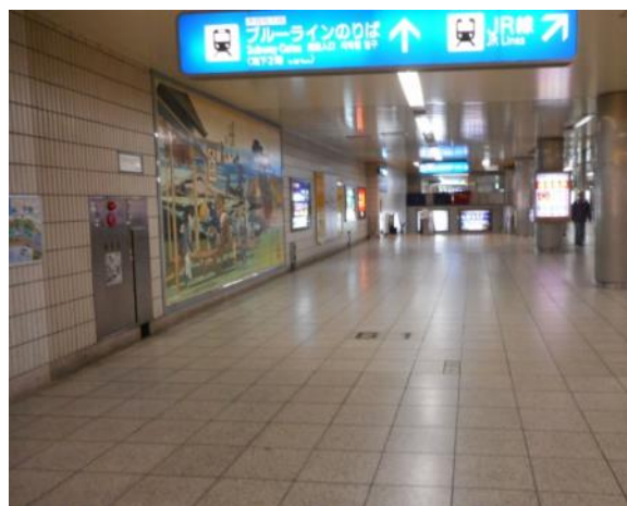
JR戸塚駅地下改札（写真右奥）前・地下鉄改札階への通路付近（11月15日撮影）