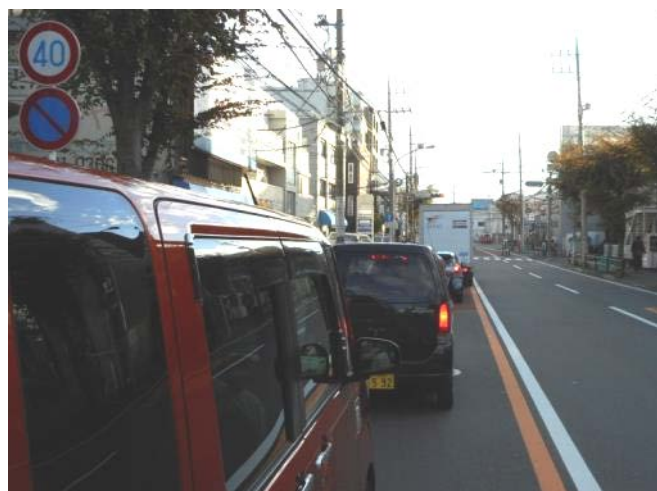
左の写真と同一地点・混雑時(11月13日撮影)