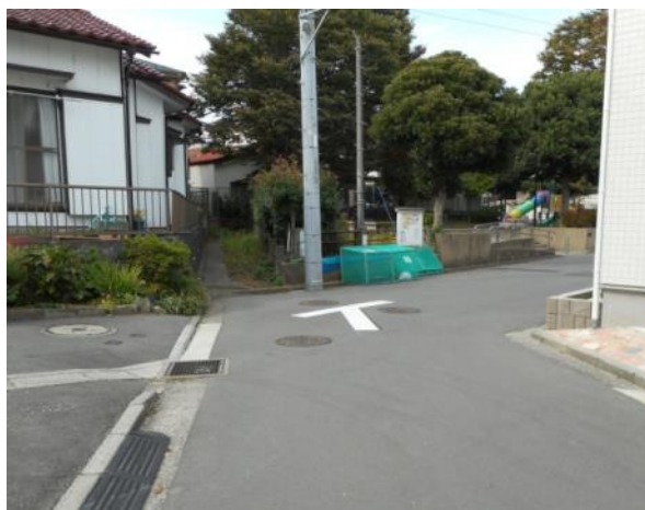
下郷町内の通学路交差点 ①(11月13日撮影)