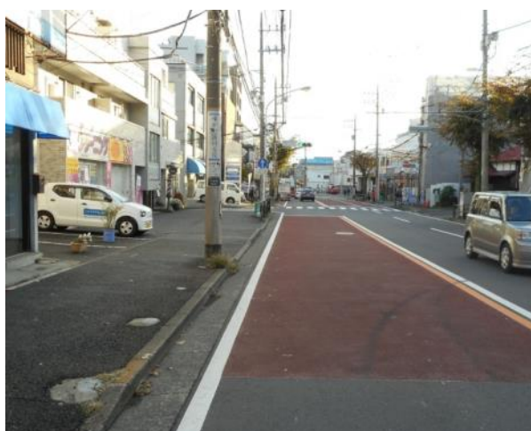
一号線側から標識の見え方(11月13日撮影)