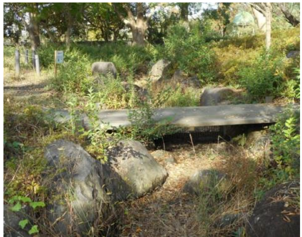
干上った導水路（11月13日撮影）