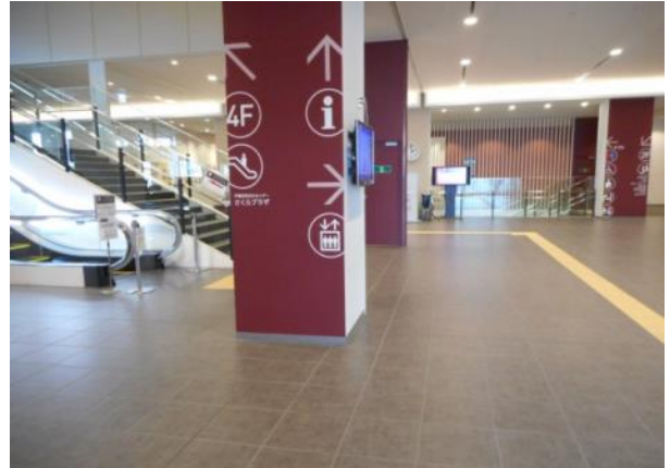
三階ロビー 四・二階アクセス（11月15日撮影）