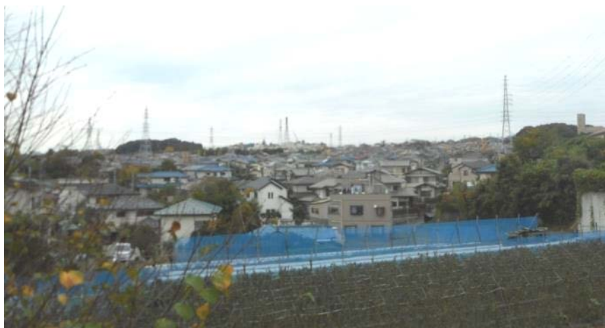
鳥が丘住宅地域・上矢部高校校門前からの景観 (11月13日撮影)