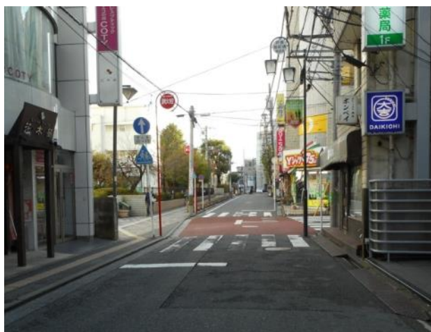
旭町通りから標識の見え方(11月13日撮影)