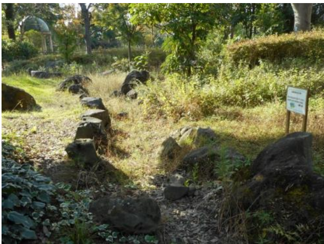
干上った導水路（11月13日撮影）