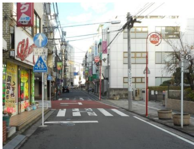
旧区役所側から標識の見え方(11月13日撮影)