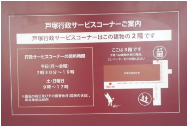
二階入口案内看板（11月15日撮影）