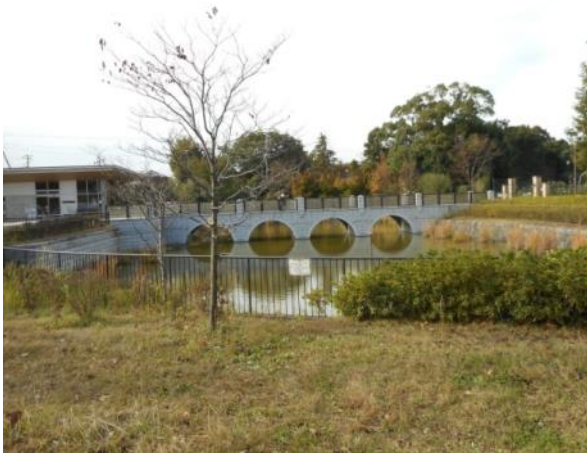
俣野公園内の池（11月13日撮影）

公園の清掃作業をしている人たちから、「池の水が汚れ、カワセミ等の小鳥が来ない状態になっている。地域住民が毎日散歩するコースであり、楽しみがなくなると嘆いている」との声が寄せられました。ポンプ施設の速やかな修繕を要望します。