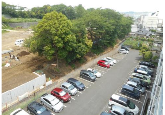
旧住友ベークライト研究所跡地の桜並木の現況（5月23日撮影）