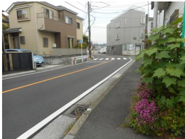
舞岡町58～100番地付近市道の路面の状況（5月25日撮影）