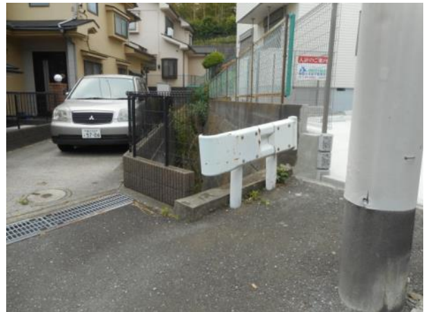
秋葉町529-1（旧戸塚台ハイツ）付近の水溜りの状況（5月23日撮影）