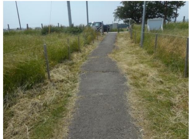
深谷通信施設跡地内道路の状態（5月23日撮影）