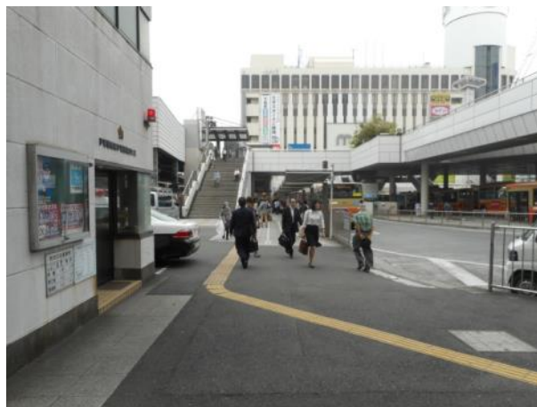
戸塚駅東口広場（バス乗降場）の状況（5月25日撮影）