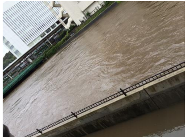
戸塚駅付近 柏尾川河床の状況 (5月25日撮影) 豪雨時の状況 (2014年10月撮影)