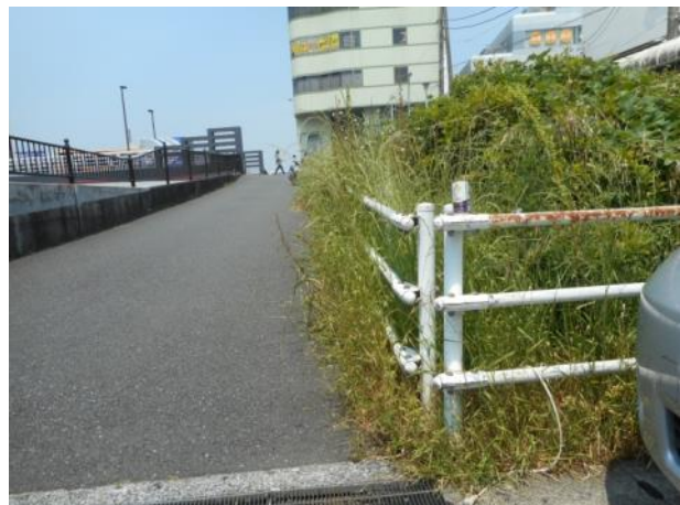
吉倉橋たもとの緑地の状況 (5月23日 撮影)