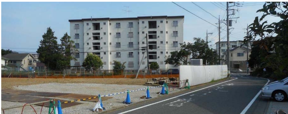
平戸平和台・開発計画予定地南西側角・交差点付近の状況（7月18日撮影）

事業者から、事前相談や協議の申し出があった際には、地元住民の要望を実現できるよう適切に対応されるよう強く要望します。