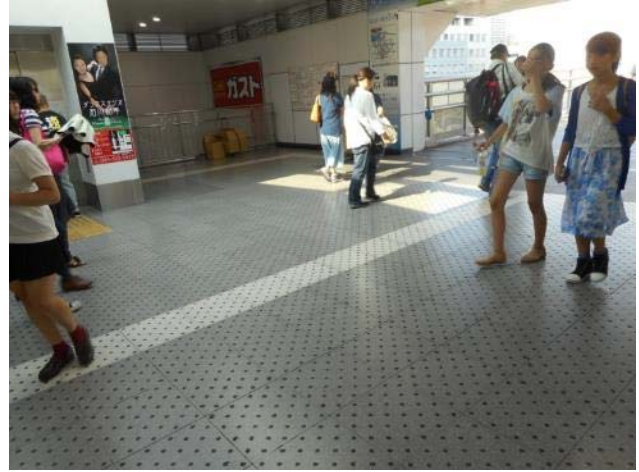
東戸塚駅改札口から東側方向への点字ブロックの設置状況（7月18日撮影）