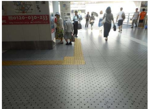
東戸塚駅改札口から東側方向への点字ブロック設置状況（7月18日撮影）