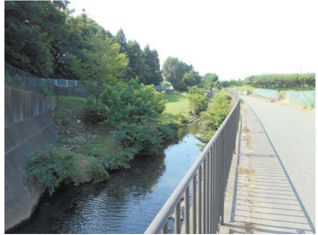
汲沢町 540 番地付近・宇田川の護岸の状況（7月18日撮影）