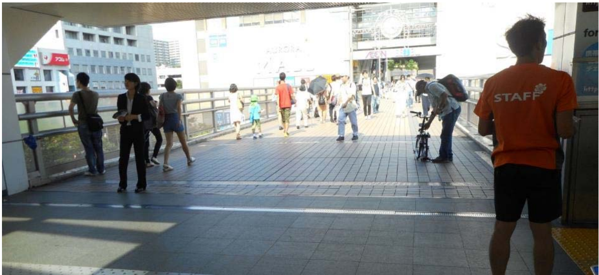
デッキ（3F）からオーロラモールへの通路に「点字ブロックなし」状況（7月18日撮影）