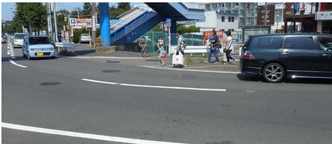
生味園前（元吉倉橋下T字路）周辺・歩道と交差点の状況（7月18日撮影）

あらためて東戸塚小学校スクールゾーン協議会が求めている諸課題を、関係機関が連携して即刻解決することを要望します。