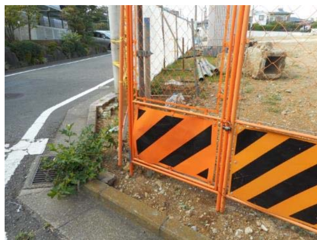
平戸平和台・開発計画予定地南西側角・交差点付近の状況（7月18日撮影）