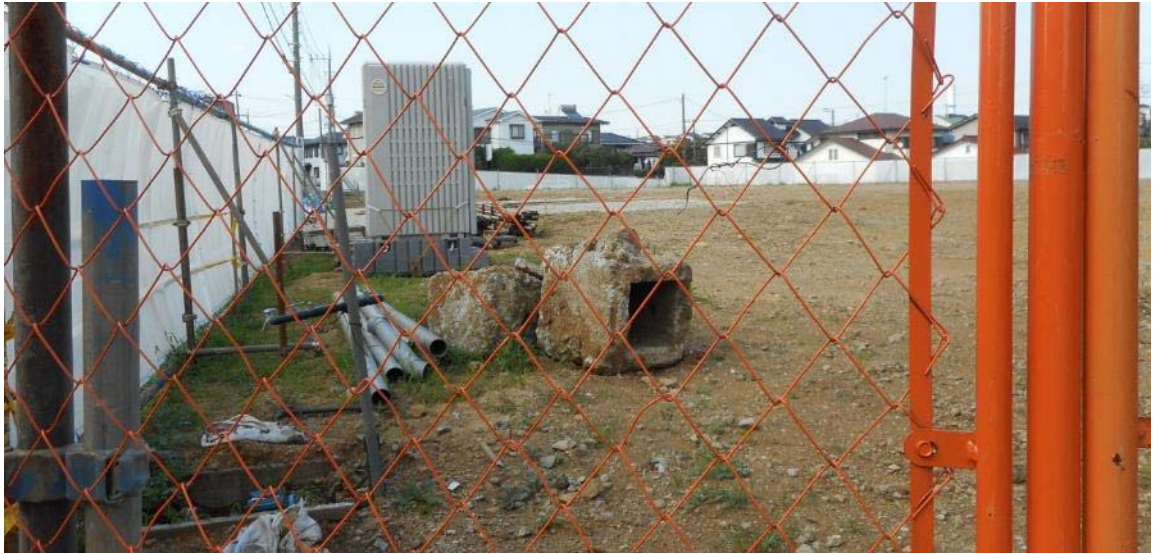
平戸平和台宅地造成現場（予定地南西側）付近の状況（7月18日撮影）