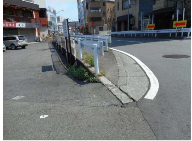
生味園前（元吉倉橋下T字路）周辺・歩道と交差点の状況（7月18日撮影）