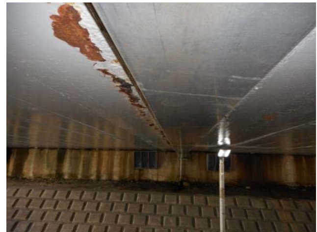
表バス停付近・隧道（上倉田町 350 番地付近）天井の水漏れ状況（7月18日撮影）