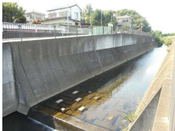
汲沢町 540 番地付近市道路面と宇田川の護岸の状況（7 月 18 日撮影）