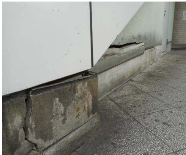
戸塚駅東口下倉田方面行バス乗り場付近歩道敷石と階段下部の状況 (10月21日 撮影)