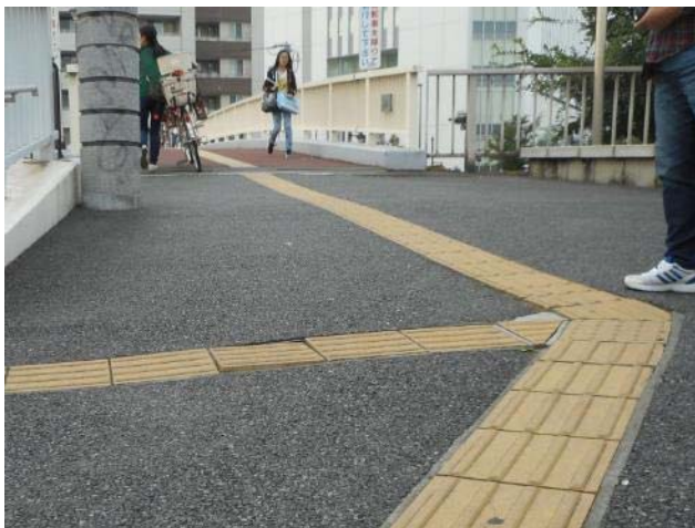
上倉田町 464 付近 点字ブロックタイル浮き上がり状況（10月21日 撮影）