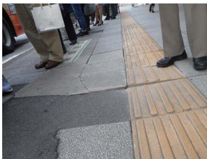
戸塚駅東口・下倉田方面行バス乗り場付近 歩道敷石の状況 (10月21日 撮影)