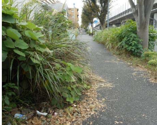
環2沿（平戸町 582-12 付近）緑地帯 雑草の状況（10月21日 撮影）