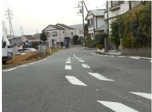
上矢部町 2449 付近 市道路面舗装の凸凹状況（10 月 21 日 撮影）