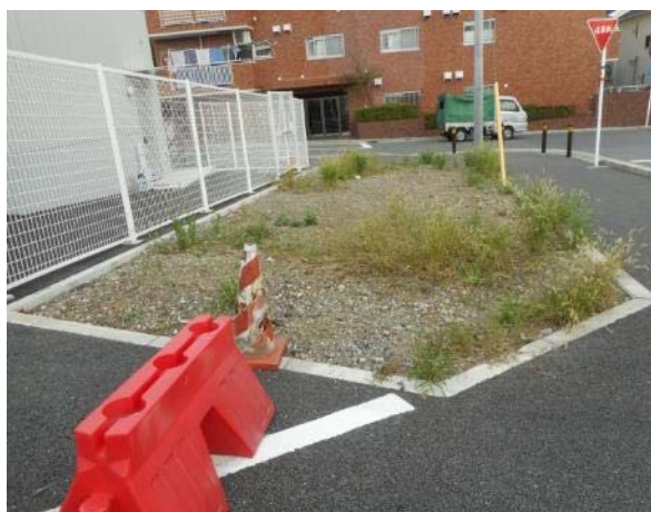
不動坂バス停付近 道路敷地内の空地の現況（10月21日 撮影）