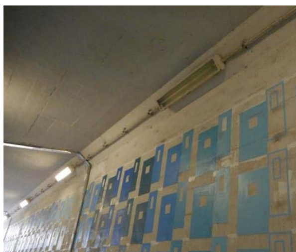
上倉田町 464 付近 階段の劣化状況（左）と隧道照明器具⑧の故障状況（右）（10月21日 撮影）