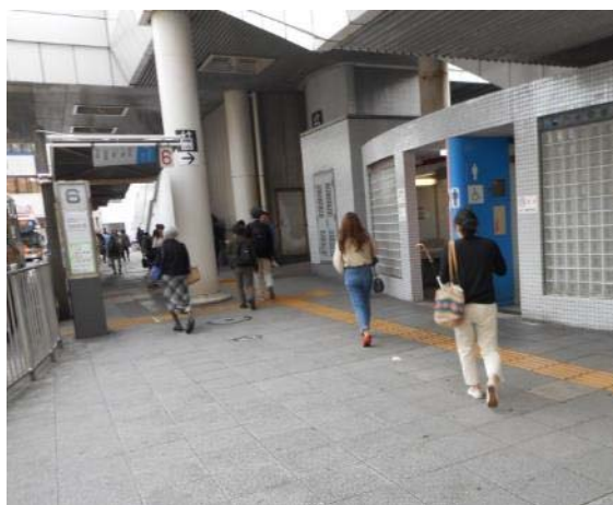
戸塚駅東口交通広場・公衆トイレ付近の状況（10月21日 撮影）