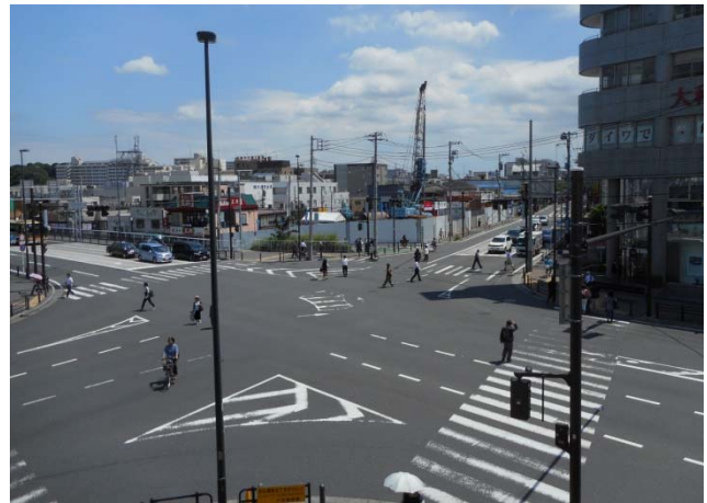
バスセンター前交差点（16年6月14日撮影）