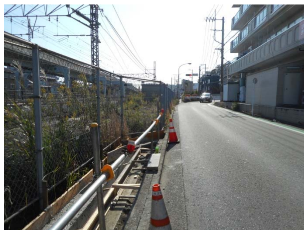
矢部町 232～291 番地付近における道路拡幅工事の状況（11月18日撮影）