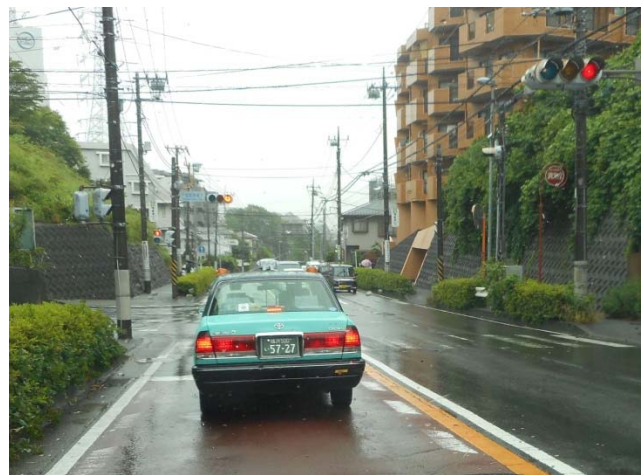
戸塚警察署下交差点(16年6月13日撮影)