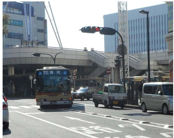
戸塚駅東口バス出口付近に駐・停車する車両（11月18日12:30頃 撮影）