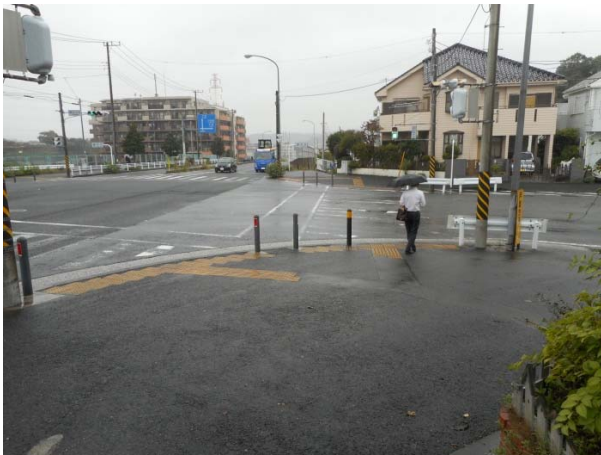
下倉田町 828 付近交差点（16年9月14日撮影）

このように改修が進められていますが、戸塚区内には、これまでの申し入れで要望した箇所を含め、まだまだ多くの摩耗劣化箇所（バスセンター前交差点、下倉田町 828 付近交差点、ほか多数）が残っています。引き続き、積極的に改修を進めることを要望します。