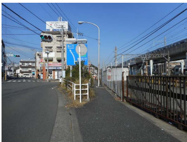
矢部町 232～291 番地付近における道路拡幅工事の状況（11月18日撮影）