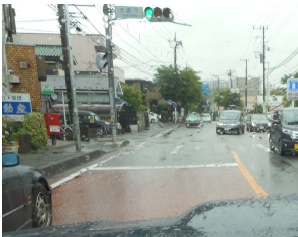
大坂下交差点（16年6月13日撮影）