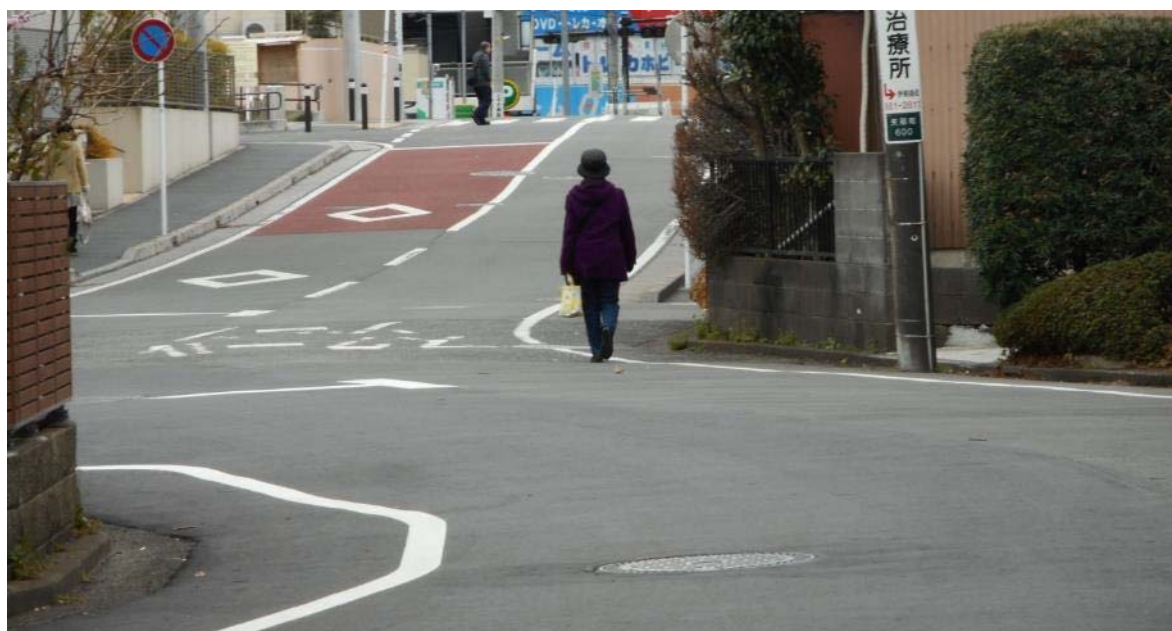
矢部町 135-32 付近 市道の状況 前方道路は両側に歩道設置 (3月15日 撮影)