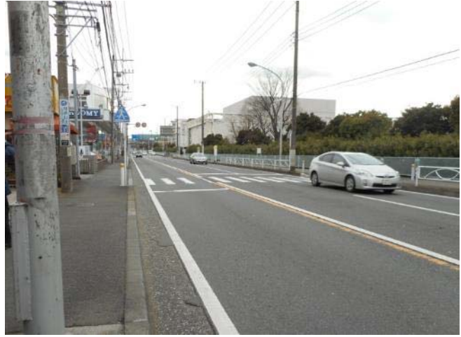
国道1号線・柏尾町185付近 信号機のない横断歩道付近の状況（3月15日 撮影）