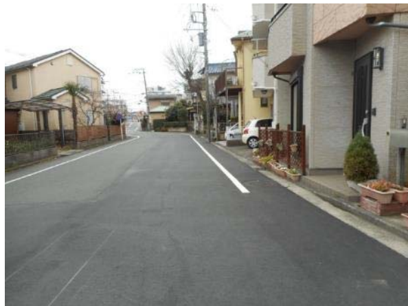
矢部町 135-32 付近 市道の状況 (3月15日 撮影)