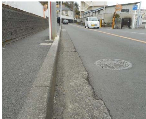
旧日立ソフト前道路（戸塚町 5030 番地付近）