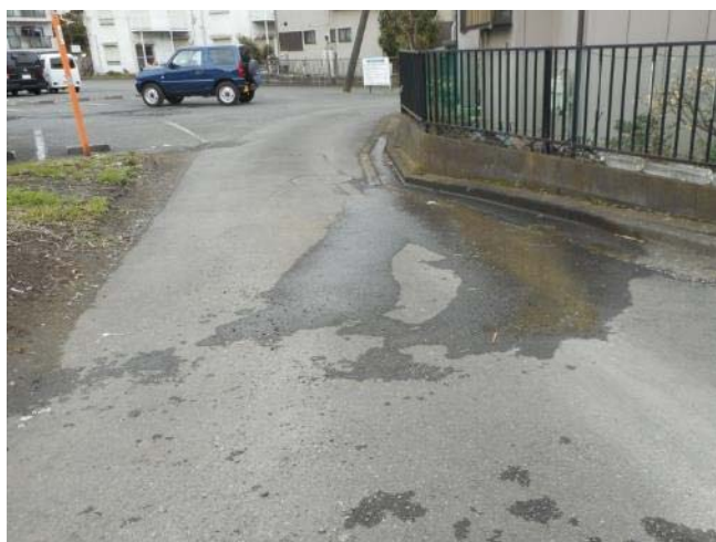
戸塚町 3208 番地付近市道 水が滲出している状況（3月15日 撮影）