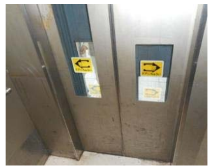
戸塚駅東口 トイレ横エレベーターの状況 (3月16日 撮影)