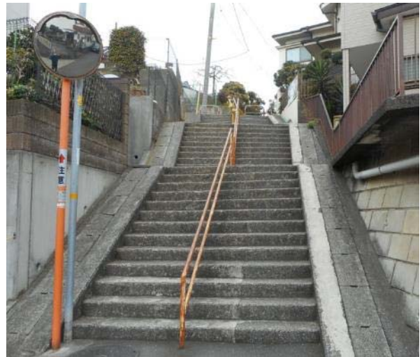
平戸平和台地域（平戸三丁目6-7付近） 階段道路の手すりの状況（3月15日 撮影）