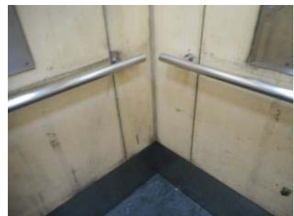
戸塚駅東口 地下鉄エレベーターの状況 (3月16日 撮影)