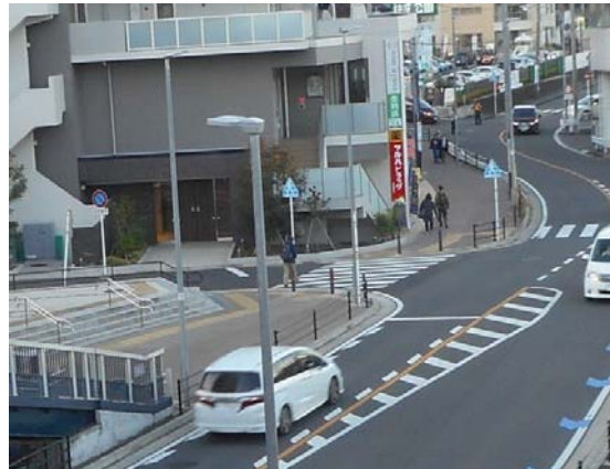
バスターミナル前市道 点字ブロック設置状況（撮影 11月18日）