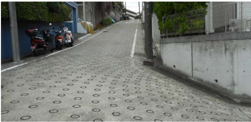
平戸2丁目6付近の急な坂道道路の状況（撮影9月24日）