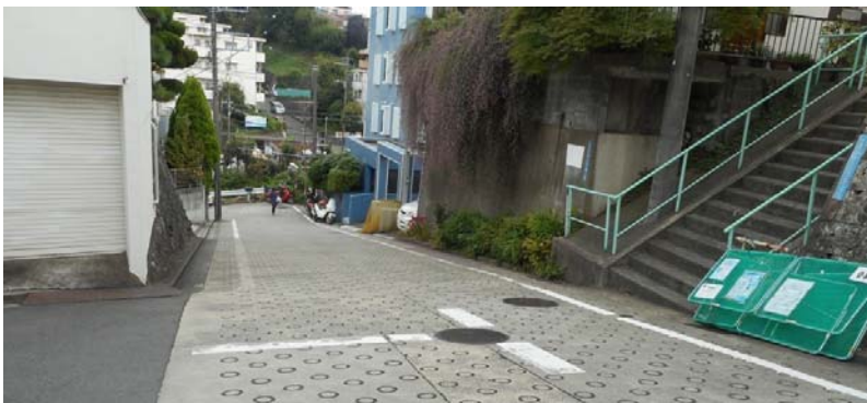
平戸2丁目6付近の急な坂道道路の状況（撮影9月24日）