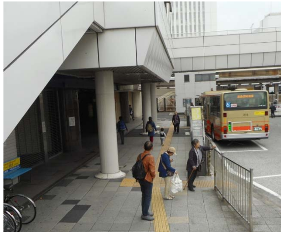
戸塚駅東口 雨漏りがひどい②番乗り場付近 (撮影 10月24日)