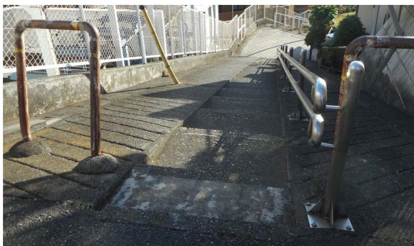
平戸2丁目32-44付近から見た階段道路の状況（撮影 11月18日）

階段部の手すりの設置箇所は民地となるため、地権者との調整が必要となり、お時間を頂きたいと考えております。」