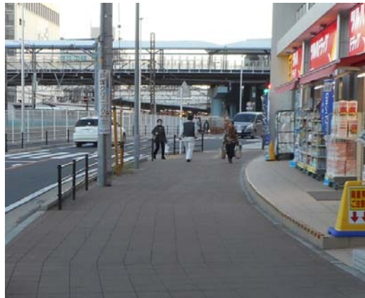
バスターミナル前市道 点字ブロック設置状況（撮影 11月18日）