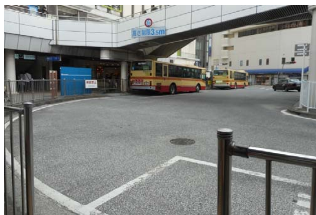
モディー前の状況（撮影 3月 24日）