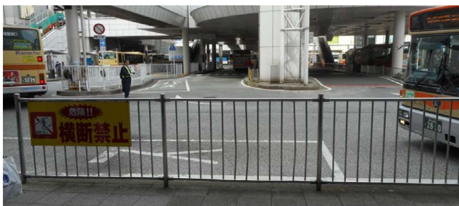
戸塚駅東口駅前広場の状況 中央：デッキ行きエレベータ（撮影 3月 24日）

また、現在、戸塚駅周辺地域では、関係区局が連携して、「住み続けたいまち道改善事業」が進められています。その進捗状況について報告いただくことも併せて要望します。