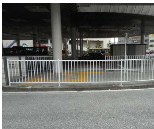
新たな「横断歩道」の設置箇所