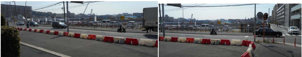
中外製薬研究所計画（日立戸塚工場跡）の現況（撮影 3 月 13 日）