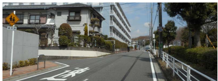
「品濃中央公園」西側市道の歩道の状況（撮影3月24日）