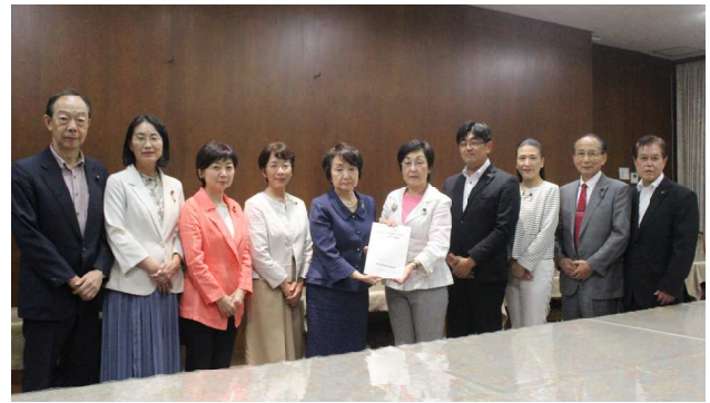
林市長に要望書を手渡す党市議団＝9月11日

開発優先からの決別などを求める市民要望は盛り込まれていません。同計画が、市民生活の実態と市民要望に目を向けたものになっていないことは明白です。