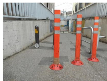
破損したカラーポールの状況（撮影 2019年2月13日～15日）