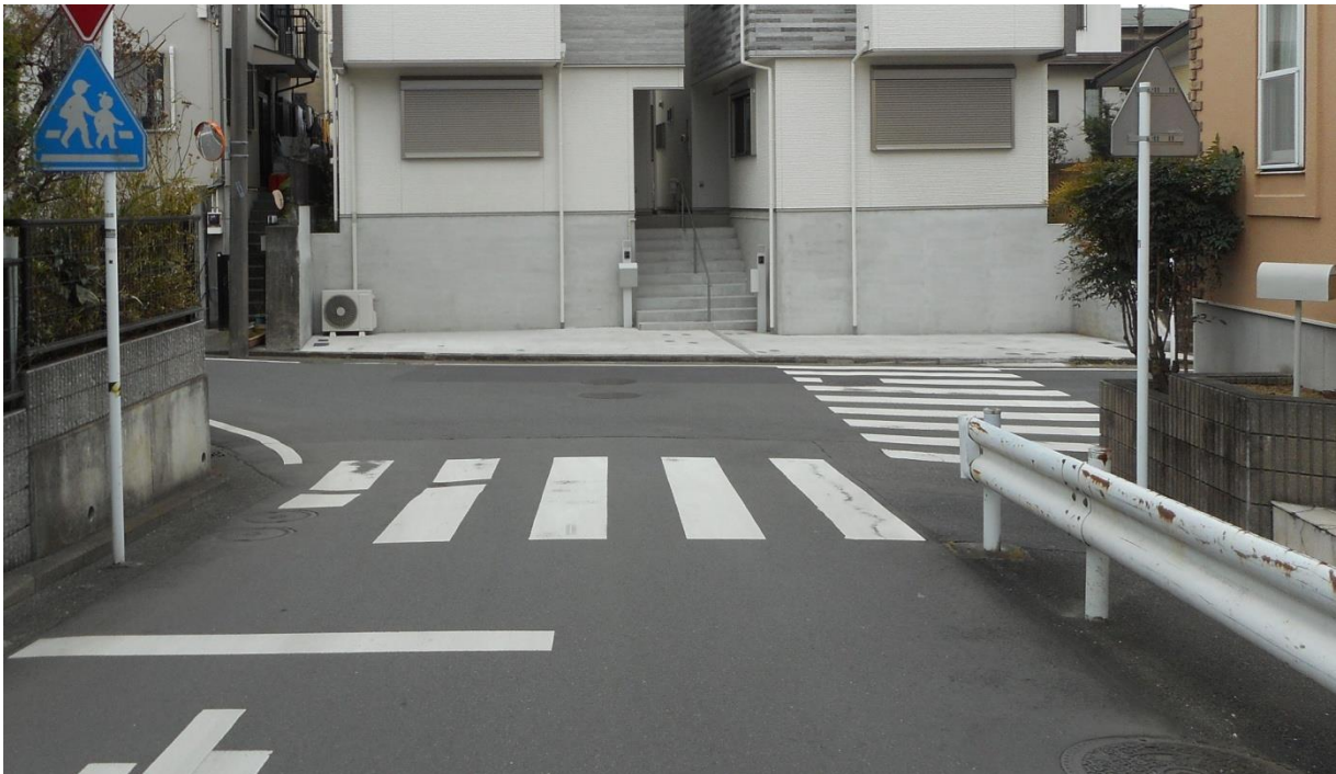
【写真 1】 汲沢 3-36 付近 カーブミラーと交差点の状況（撮影 2019 年 2 月 12 日）