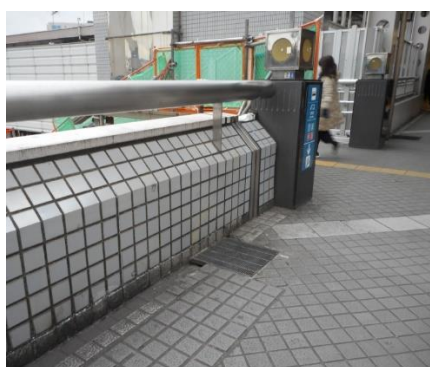
雨水排水溝の泥詰まりの状況（撮影 2019年2月13日）