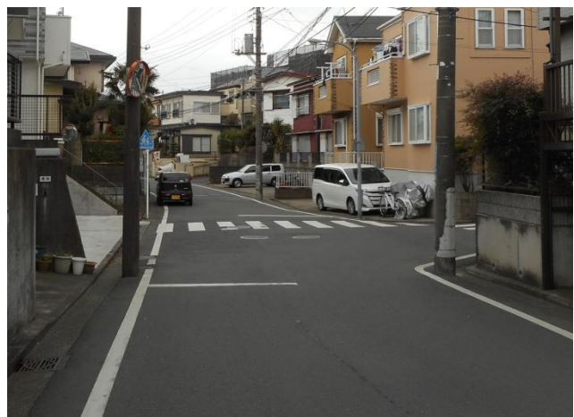
カーブミラーと交差点の状況（撮影 2019 年 2 月 12 日）