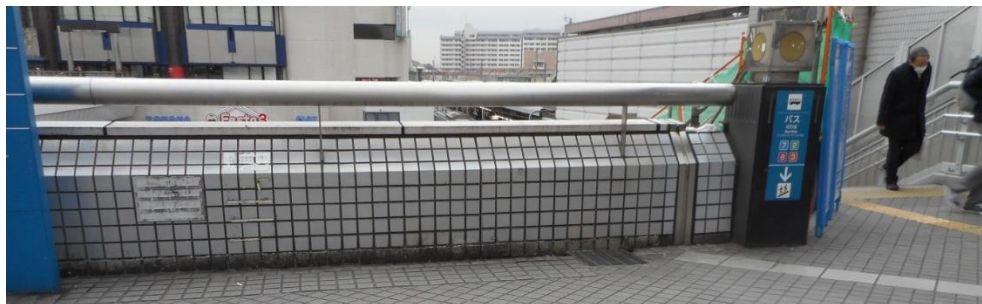
戸塚駅東口デッキ 雨水排水溝の泥詰まりの状況（撮影 2019年2月13日）

戸塚駅東口デッキ（駅側階段上付近）に大きな水たまりが出来ます。雨水溝に泥等が詰まっているためと思われます。大雨の時に大きな水たまりが出来て、バス乗り場に雨漏りして利用者が困っています。詰まりを取り除き、水捌けを良くして雨漏り防止を要望します。