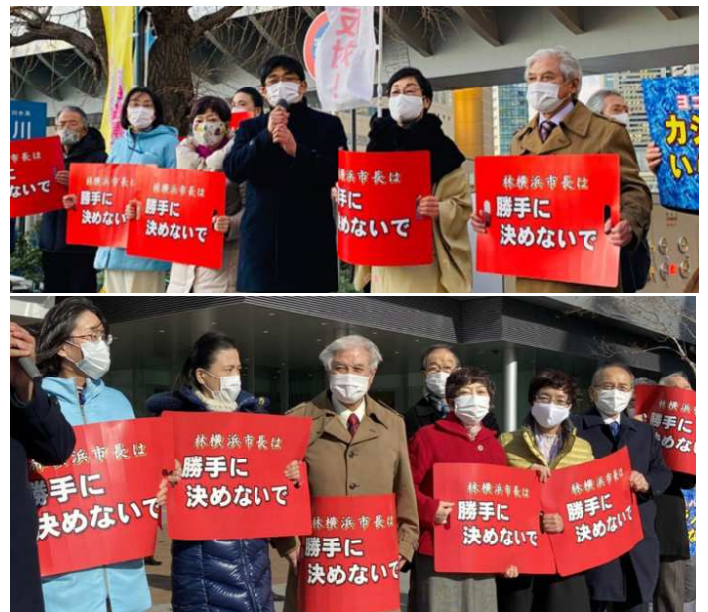
市役所前でのアピール行動

この運動は、夏に行われる市長選挙のたたかいにつながるはずですが、ここに確信と展望を見出すことができます。